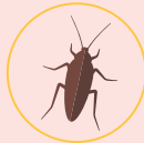
Les cafards et blattes