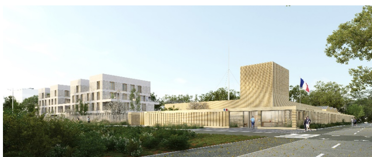
Caserne de gendarmerie de Moulon ©Palast-Nicolas Lombardi Architecture

d'opérations mixtes : programme de logements familiaux, équipements publics et sportifs, services et commerces qui participent à la vitalité du campus.